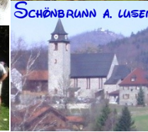
SCHÖNBRUNN A. LUSEN