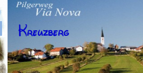
Pilgerweg Via Nova KREUZBERG